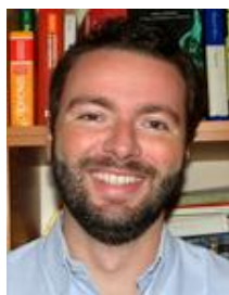
ミラノ大学口腔外科、ミラノ大学大学院インプラント歯科 講師 Italian Society of Oral Surgery and Implantology メンバー Italian Society of Osseointegration メンバー Italian Society of Periodontology メンバー ITI Fellow